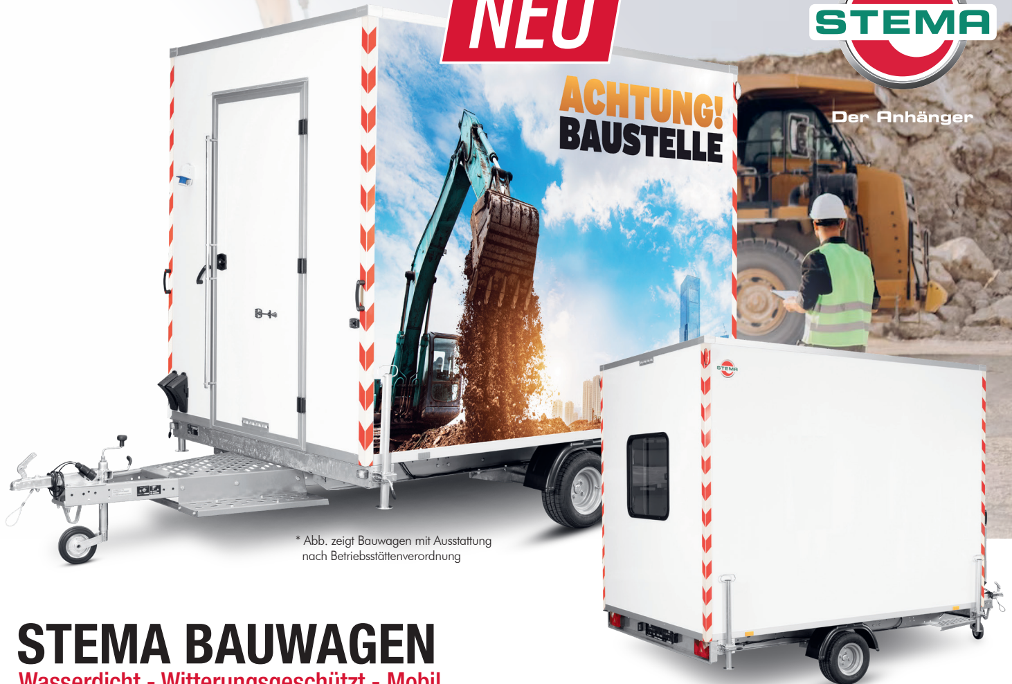
* Abb. zeigt Bauwagen mit Ausstattung nach Betriebsstättenverordnung